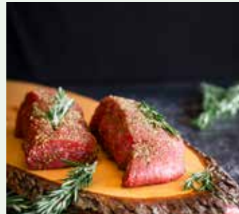
Pelée Royal (te bestellen per 2 pers.)