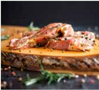
Côte à l'os (te bestellen per 2 pers.)